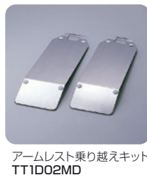
アームレスト乗り越えキット TT1D02MD